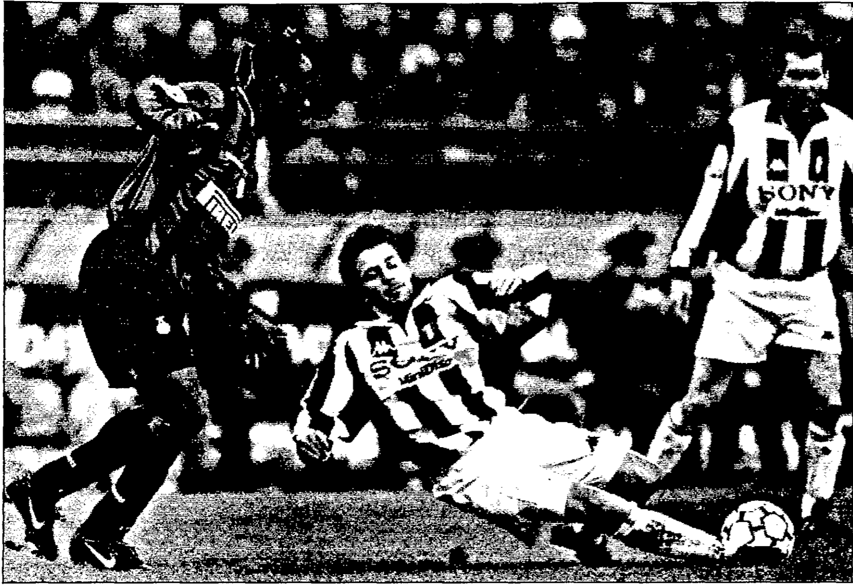
السيد مدينو يديرو مهاجم يوفنتوس (في الوسط) في إحدى مباريات فريقه (أرشيف)